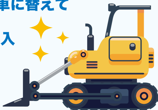
フォークリフト (耐用年数: 4年)